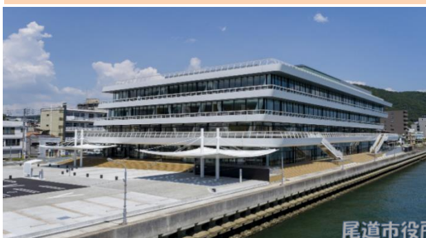
尾道市役所 本庁舎